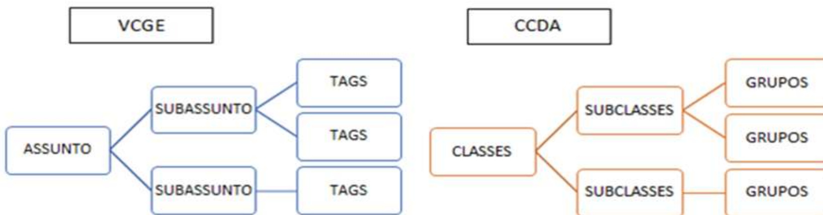
Figura 2 – Estruturação de um esquema de classificação do Fala.BR e CCDA 1