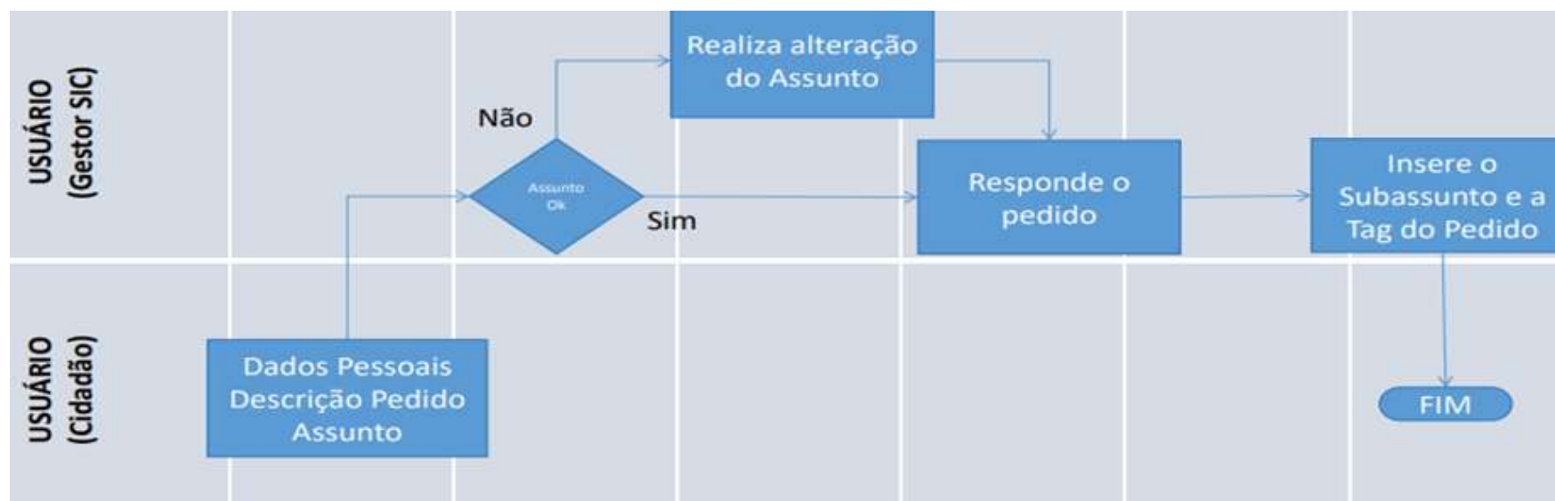
Figura 1 – Fluxo do pedido de acesso à informação