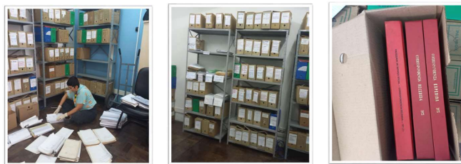
Figura 03: Trabalho de seleção e identificação dos documentos no arquivo.