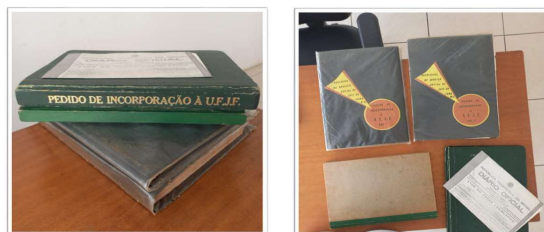
Figura 02: Fac. Serv. Social. Processos de Pedidos de Incorporação à UFJF.