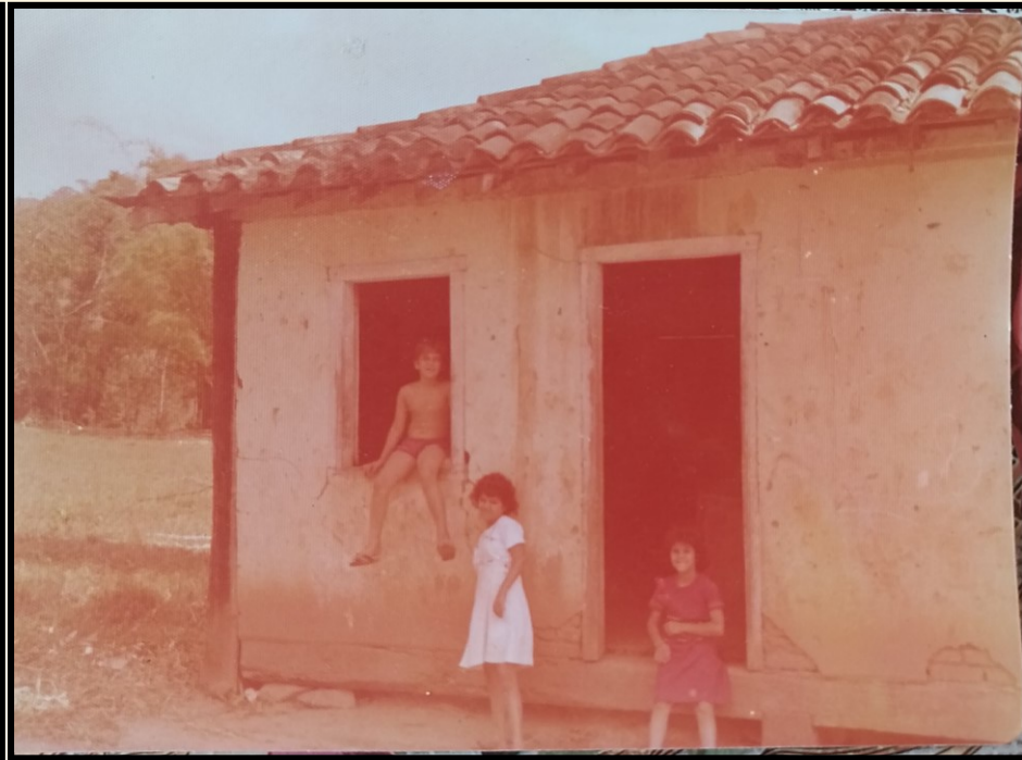
Escola Rural - São Pedro dos Ferros (MG) - Entre 1981-1984