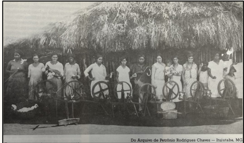
Do Arquivo de Petrônio Rodrigues Chaves — Ituiutaba, MG