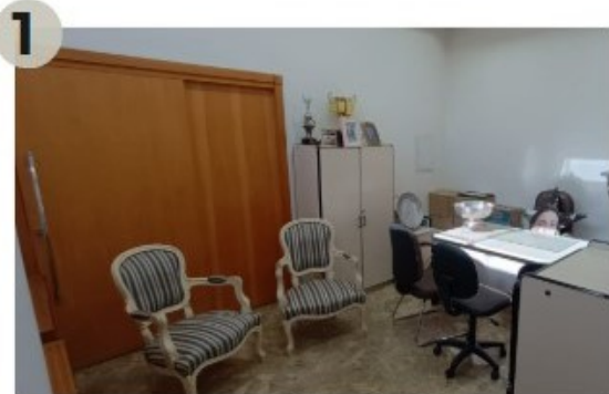
04/06/2024 - Espaço e definição de sala de tratamento