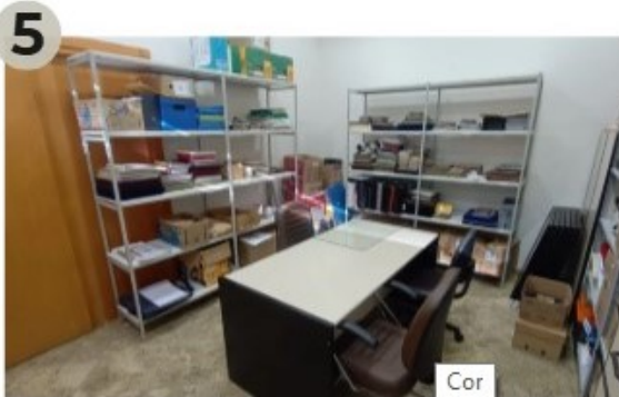
17/09/2024 - Finalização da separação de álbuns por categorias; início da pré-identificação