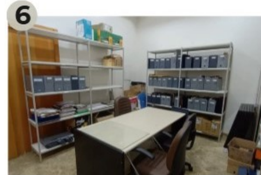
06/12/2024 - Finalização da pré-identificação, contagem e acondicionamento