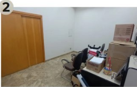
02/08/2024 - Organização do espaço para colocar as estantes