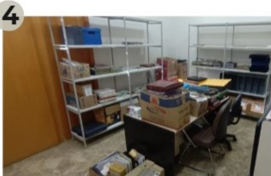
30/08/2024 - Transferência do acervo fotográfico para sala de tratamento