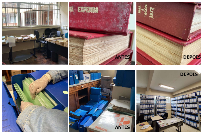
Figura 02: Etapas