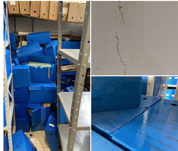
Figura 01: Sala do Arquivo Setorial após o Sinistro