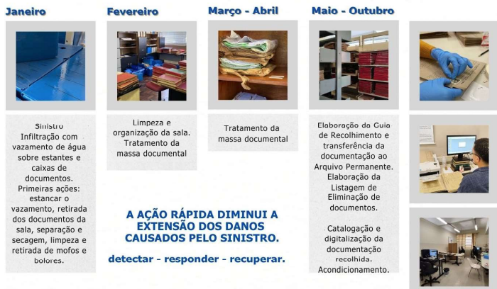
Figura 03: Tratamento da MDA