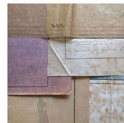
Figura 01: Suportes

Optamos por mantê-los em mapoteca, a fim de se evitar danos futuros devido ao manuseio inadequado ou exposição à luz.